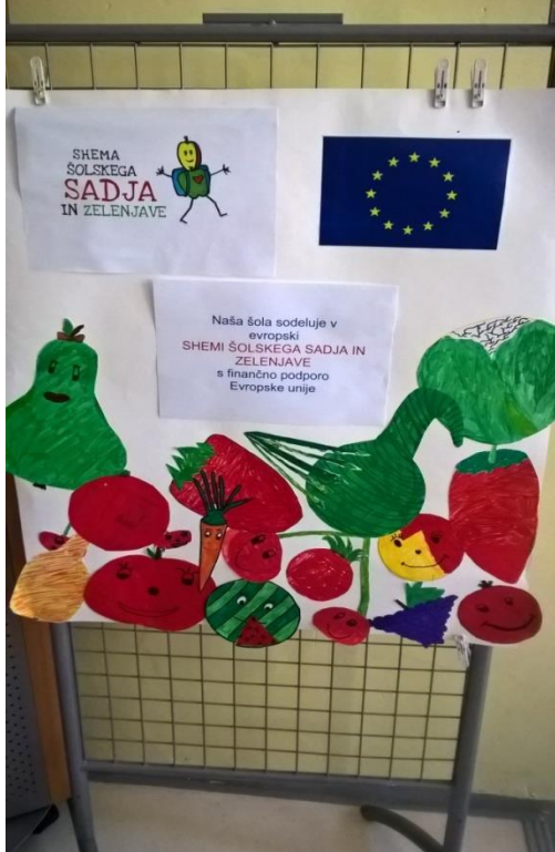
Podružnična OŠ Bilje